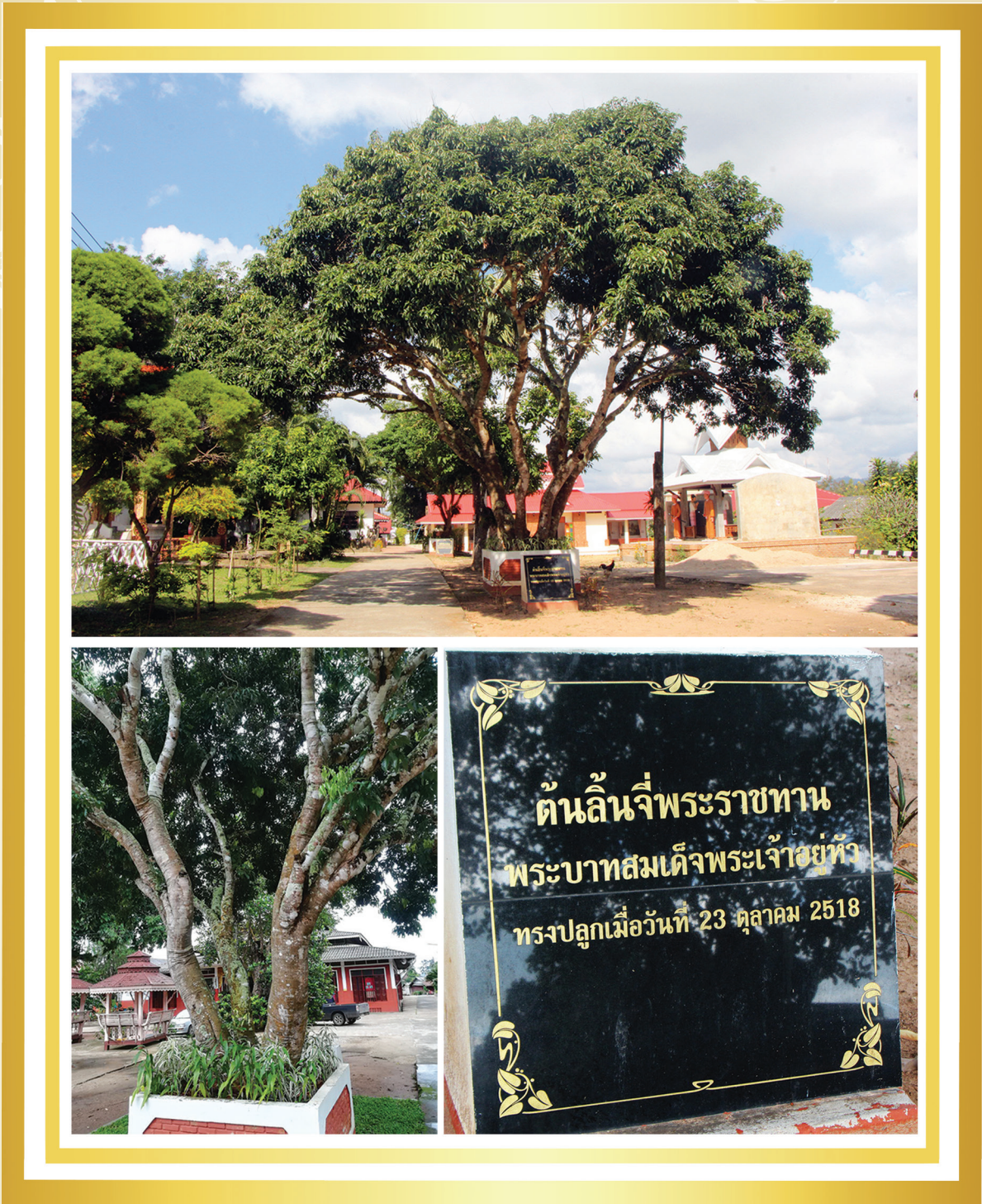
ความโตที่ระดับความสูงเพียงอก (DBH) ๓๙ เซนติเมตร สูง ๑๕ เมตร พิกัด GPS ในระบบ UTM (WGS๘๔) ๔๓Q๓๘๓๖๔๖ / ๒๐๘๒๒๕๒